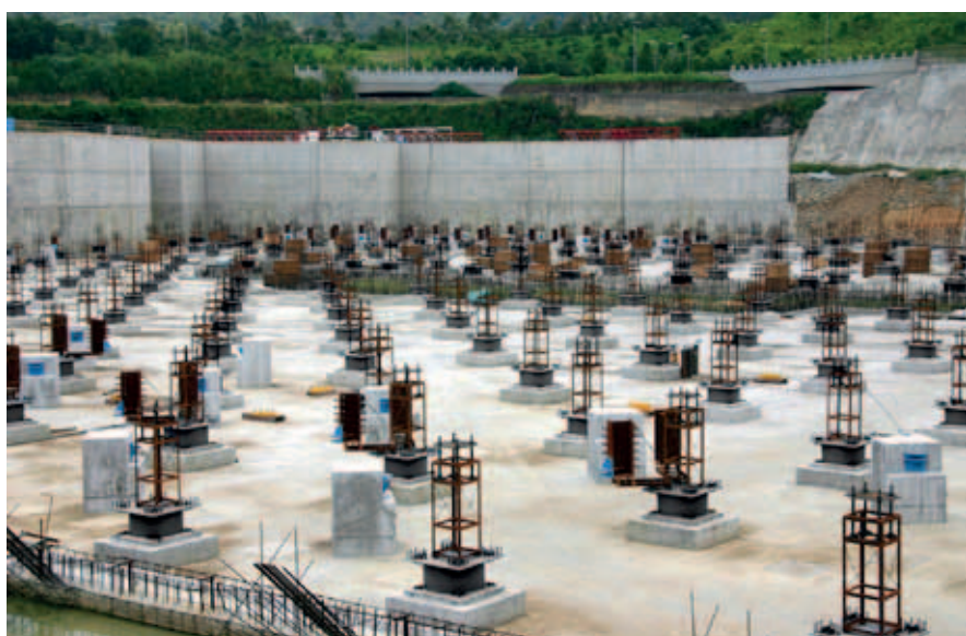
Figuur 4: Base isolation van het Tan Tzu Medical Center in Taiwan.