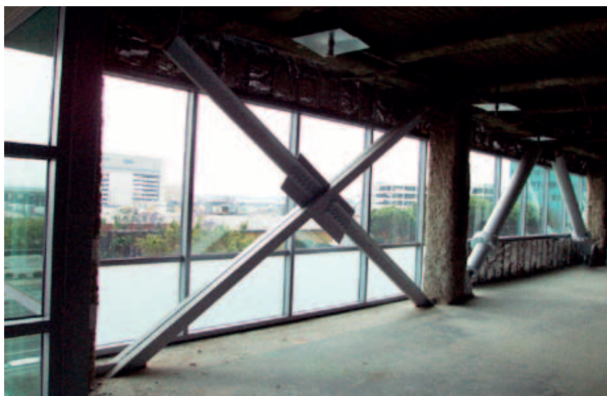
Figuur 3: Kruisverbanden en dempers.